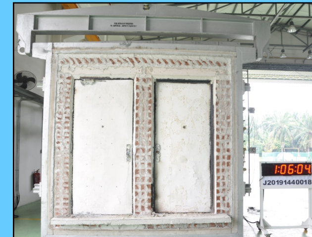
Gambar: Keadaan permukaan specimen pintu rintangan api (satu daun) yang terdedah dengan api untuk tempoh 1 jam.