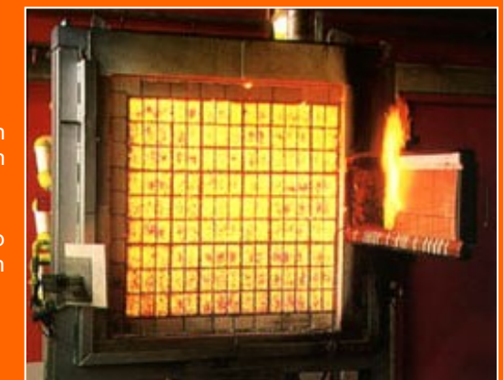
Fasiliti ujian mengikut piawaian BS 476:Part 7