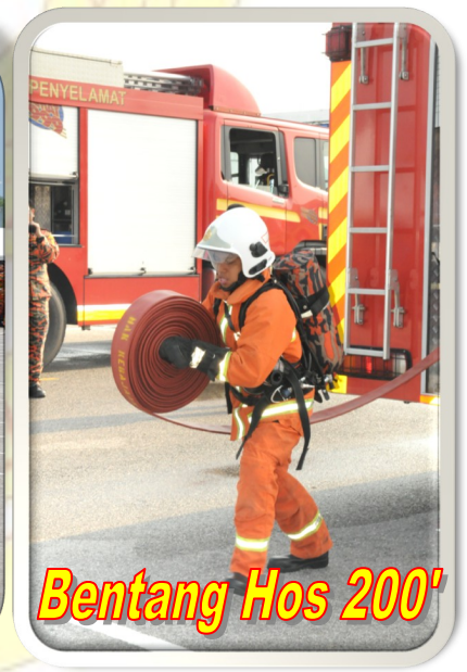
Bentang Hos 200'