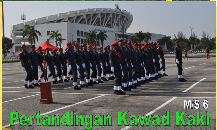
Pertandingan Kawad Kaki M/S 6