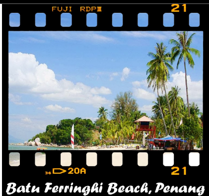
Batu Ferringhi Beach, Penang