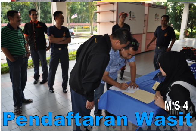
Pendaftaran Wasit M/S 4