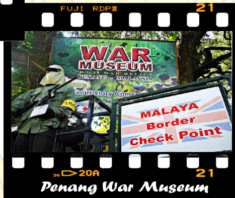
Penang War Museum