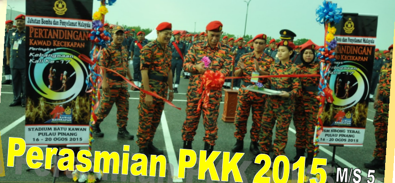
Perasmian PKK 2015 M/S 5