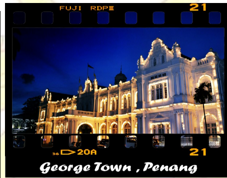
George Town, Penang