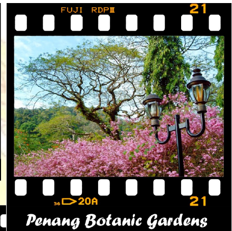
Penang Botanic Gardens