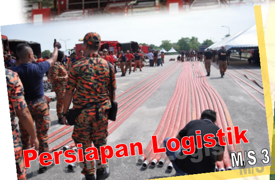
Persiapan Logistik M/S 3

Jabatan Bomba dan Penyelamat Malaysia Negeri Pulau Pinang