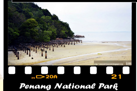
Penang National Park