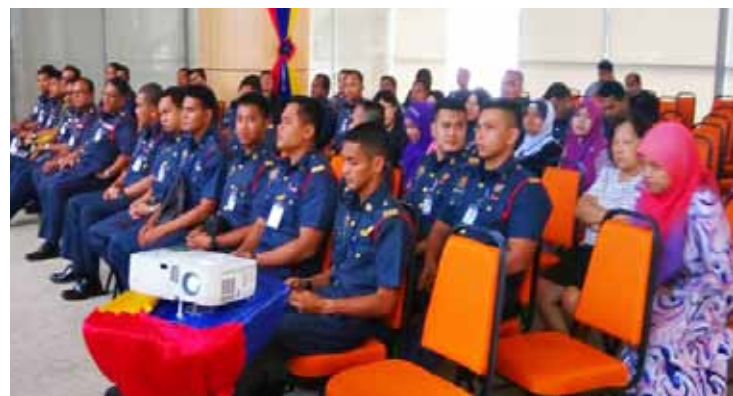
Pegawai Bomba dan kakitangan tekun mendengar ceramah yang disampaikan