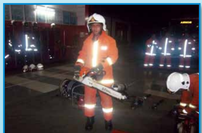
Pegawai Bomba menguji peralatan berenjin bagi memastikan peralatan dalam keadaan baik dan boleh digunakan

Bermula dengan ujian panggilan kecemasan atau "test call", panggilan baris serta pemeriksaan ketrampilan pegawai dan kelengkapan perlindungan diri (PPE), pemeriksaan persekitaran balai dan ruang pejabat serta keadaan jentera, dan mengadakan latihan penggunaan peralatan kebombaian dan