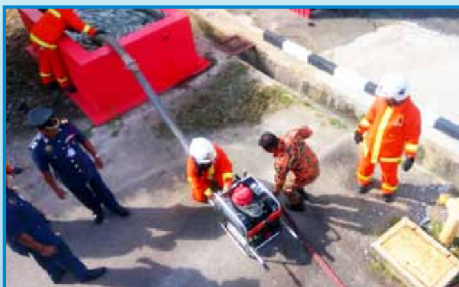
Ujian terhadap Pam Angkut Godiva bagi memastikan pam dalam keadaan baik untuk digunakan.