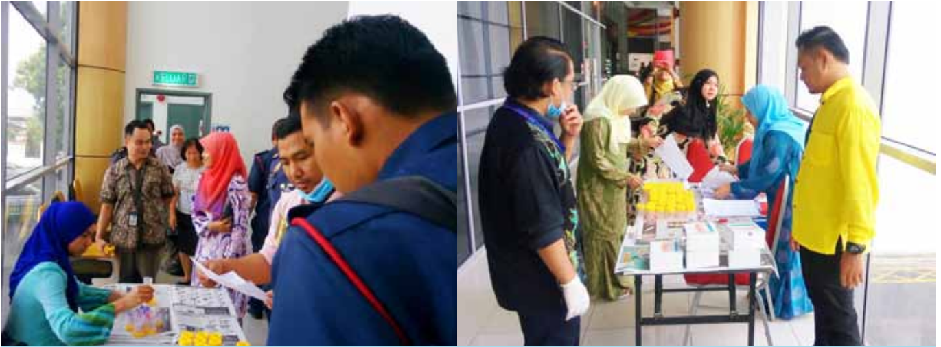
Para pegawai dan kakitangan sedang menjalani saringan air kencing

Program saringan air kencing turut diadakan yang melibatkan seramai 64 orang pegawai dan kakitangan termasuk pegawai dari AADK seramai 13 orang. Hasil saringan tersebut mendapati semua pegawai dan kakitangan didapati negatif dadah. Program seumpama ini akan diteruskan lagi dari masa ke semasa dalam memastikan tempat kerja bebas dadah.