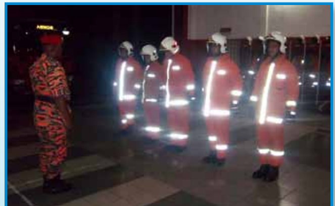
Panggilan baris oleh Pegawai Penyelia dengan Anggota yang bertugas sebelum melaporkan kekuatan anggota.