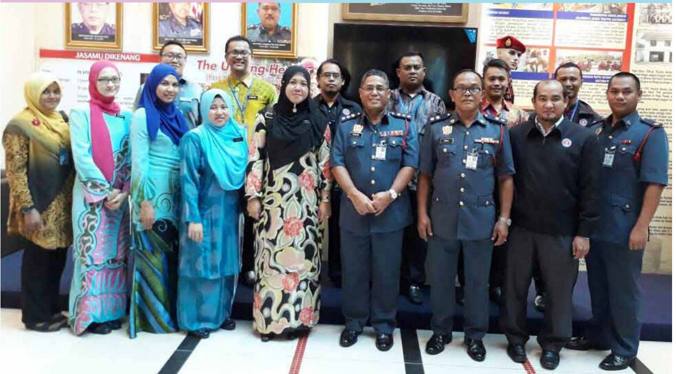
Unit Integriti JBPM bergambar bersama-sama pegawai Agensi Antidadah Kebangsaan.