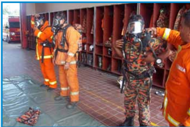
Pegawai melakukan latihan penggunaan Breathing Apparatus (BA)