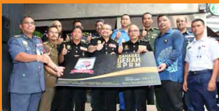
Wakil-Wakil Jabatan yang hadir bergambar