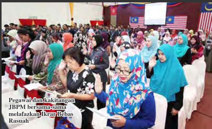
Pegawai dan kakitangan JBPM bersama-sama melafazkan Ikhar Bebas Rasuah