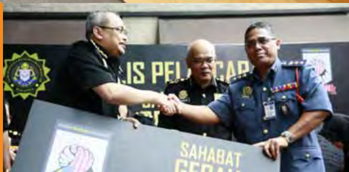
Ketua Pesuruhjaya SPRM menyerahkan simbolik kad keahlian SAHABAT GERAH SPRM

Pelancaran Sahabat GERAH pada 1 Ogos 2017 adalah bagi memberi peluang kepada masyarakat untuk sama-sama terlibat dengan SPRM dalam usaha pencegahan rasuah. Sahabat GERAH SPRM juga menjadi medium penghubung antara SPRM dan masyarakat, yang seterusnya menggalakkan interaksi kedua-dua pihak.