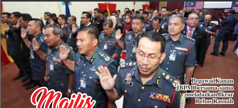
Pegawai Kanan JBPM bersama-sama melafazkan Ikrar Bebas Rasuah