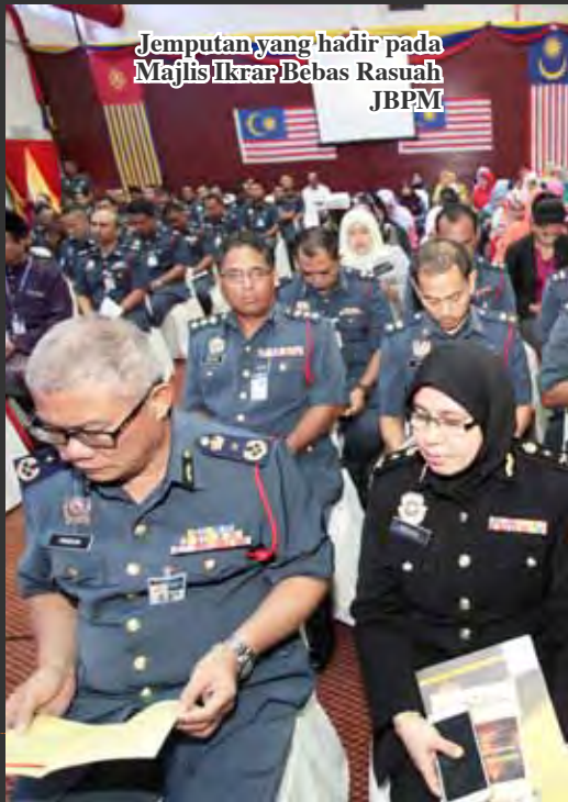
Jemputan yang hadir pada Majlis Ikhar Bebas Rasuah JBPM