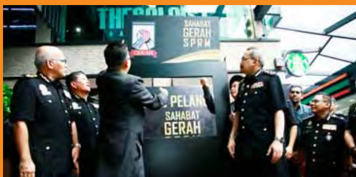
Gimik Pelancaran Sahabat GERAH SPRM yang telah disempurnakan