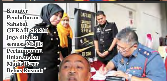
Kaunter Pendaftaran Sahabat GERAH/SPRM juga dibuka semasa Majlis Perhimpunan Bulanan dan Majlis Ikrar Bebas Rasuah