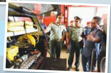
Lawatan ke Balai Bomba dan Penyelamat Shah Alam