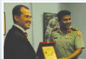
YAS KP JBPM menyampaikan cenderamata kepada Mejar Jeneral Ahmed Shiyam, Chief Defence Force , Maldives