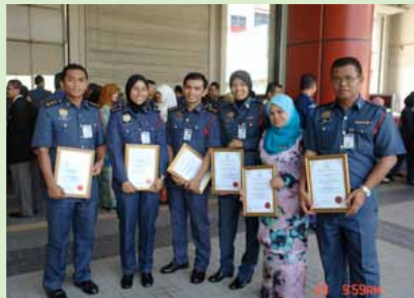
Pegawai-Pegawai Jabatan yang telah menyertai Program Mengibarkan Bendera JBPM di Puncak Gunung Kinabalu