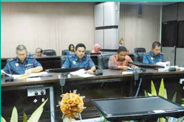
Pegawai-Pegawai Kanan JBPM yang hadir semasa kunjungan hormat tersebut