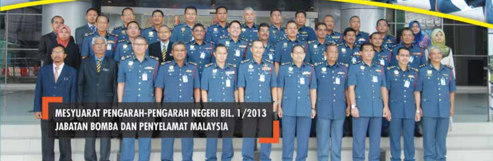
MESYUARAT PENGARAH-PENGARAH NEGERI BIL. 1/2013 JABATAN BOMBA DAN PENYELAMAT MALAYSIA