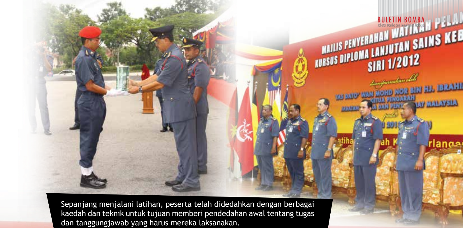
Sepanjang menjalani latihan, peserta telah didedahkan dengan berbagai kaedah dan teknik untuk tujuan memberi pendedahan awal tentang tugas dan tanggungjawab yang harus mereka laksanakan.