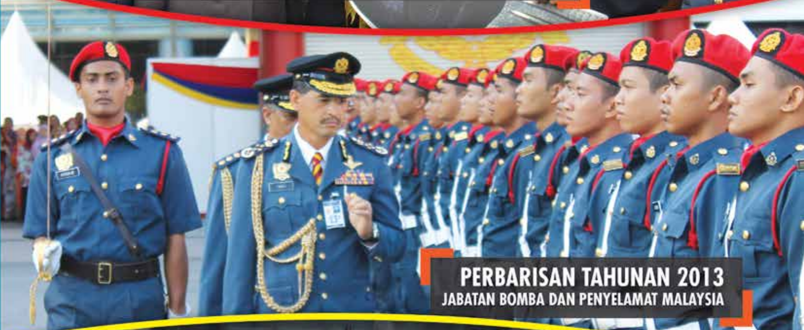
PERBARISAN TAHUNAN 2013 JABATAN BOMBA DAN PENYELAMAT MALAYSIA