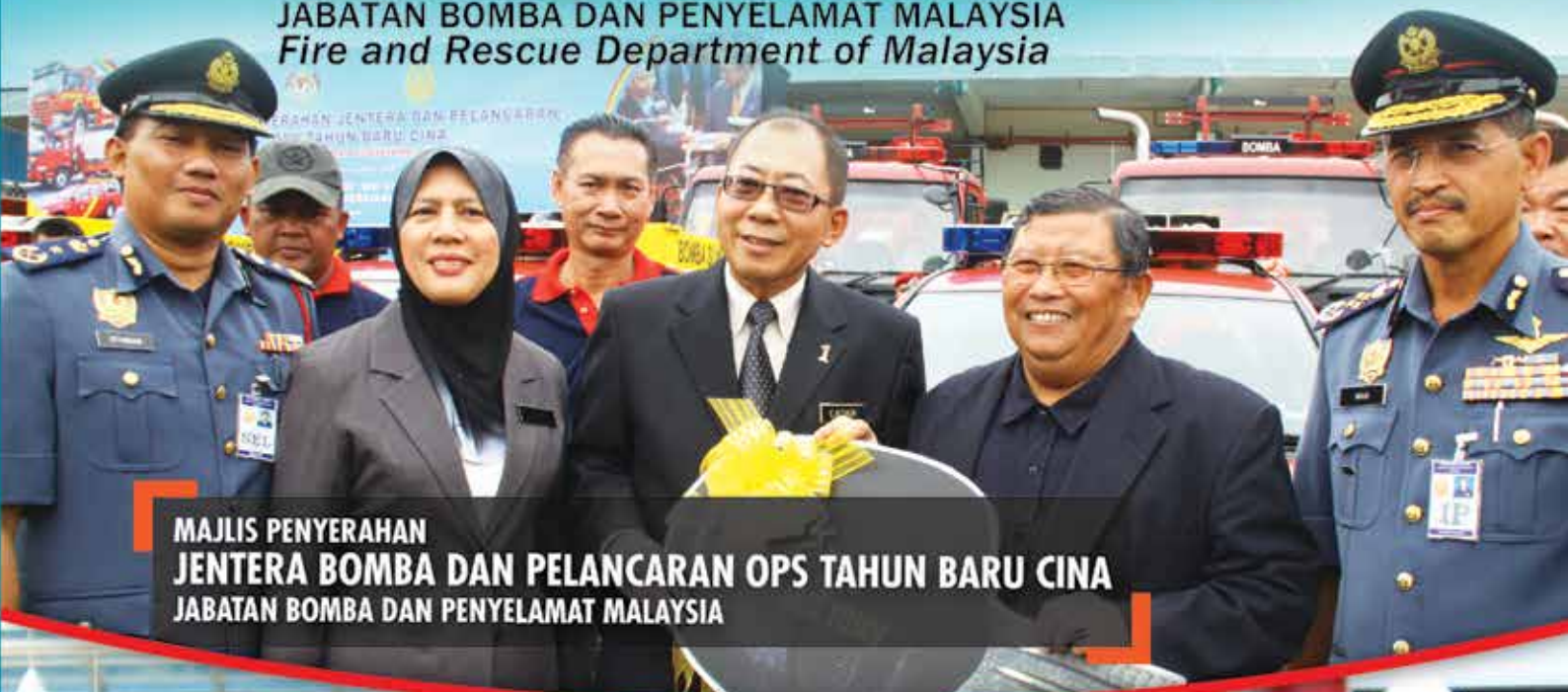
MAJLIS PENYERAHAN JENTERA BOMBA DAN PELANCARAN OPS TAHUN BARU CINA JABATAN BOMBA DAN PENYELAMAT MALAYSIA

JABATAN BOMBA DAN PENYELAMAT MALAYSIA Fire and Rescue Department of Malaysia