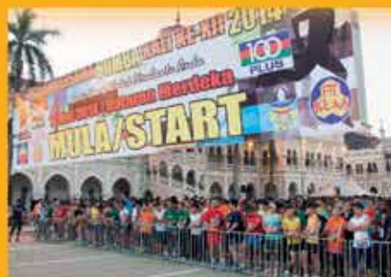
LARIAN BERSAMA BOMBA KALI KE XII