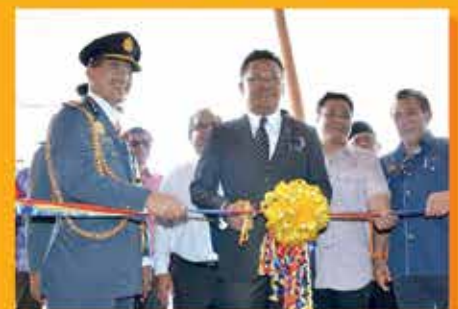
MAJLIS PERASMIAN BALAI BOMBA DAN PENYELAMAT KOTA KINABATANGAN, SABAH