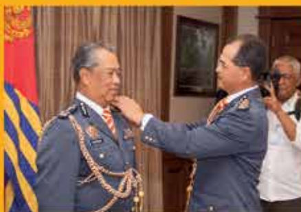
MAJLIS PENGANUGERAHAN PANGKAT TIMBALAN PESURUHJAYA BOMBA KEHORMAT