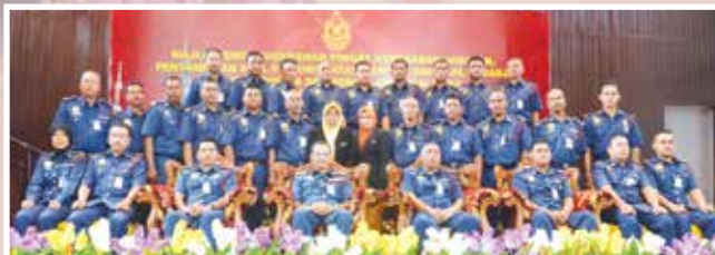
Penerima Sijil Perkhidmatan Terpuji bergambar kenang-kenangan bersama YAS Ketua Pengarah

YAS Ketua Pengarah juga telah menyampaikan sumbangan kebajikan sebanyak RM16,000.00 daripada Skim Perlindungan Takaful Berkelompok kepada Puan Napisah binti Deraman gemulah kepada Allahyarham PBK II Mohd Jebri bin Awang yang meninggal dunia dalam perkhidmatan pada 12 September 2013 disebabkan oleh Cardiac Aritrimia Attack. Diharapkan sumbangan yang disampaikan sedikit sebanyak akan dapat membantu keluarga Allahyarham untuk meneruskan kehidupan.