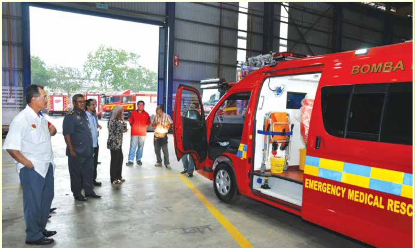
Lawatan tersebut diadakan bertujuan untuk membuat pemeriksaan status terkini jentera Fire Resque Tender (FRT), EMRS dan Water Tanker serta memastikan supaya semua perolehan tersebut mengikut jadual yang telah ditetapkan.